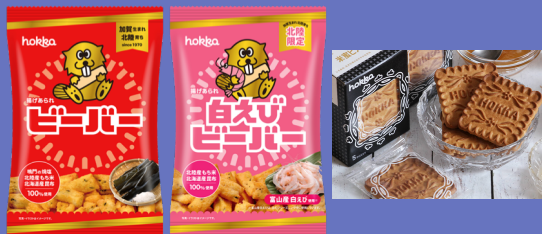
主力商品（ビーバー、米蜜ビスケット）