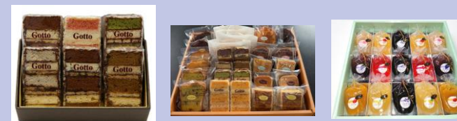
▲(株)パルポーの洋菓子商品

主力商品である「Gotto」の詰め合わせ(左図)と「Gotto」と焼き菓子の詰め合わせ(中図)、季節菓子である「パルポーのフルーツたち」(右図)