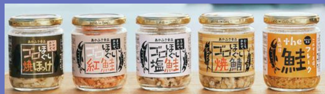
自社ブランドの水産加工品 「ゴロほぐしシリーズ」

○本社所在地：宮城県気仙沼市 ○事業概要：水産加工品の製造販売 ○常時使用する従業員：87名 （グループ全体・2025年3月時点） ○現在の売上高：15億円 （グループ全体・2025年3月期） ○法人番号：9370501000882 ○Web：https://www.akafusa-foods.co.jp/