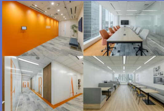
浜松町本社オフィス

○本社所在地：東京都港区浜松町 1 丁目 30-5 浜松町スクエア11階 ○事業概要： 英語コーチングサービス / サブスクリプション型英語学習サービス ○常時使用する従業員：238名 (2025年8月時点) ○現在の売上高：57億円 (2025年8月期) ○法人番号：4010001178269 ○Web：https://about.progrit.co.jp/