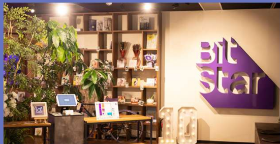
事務所エントランス