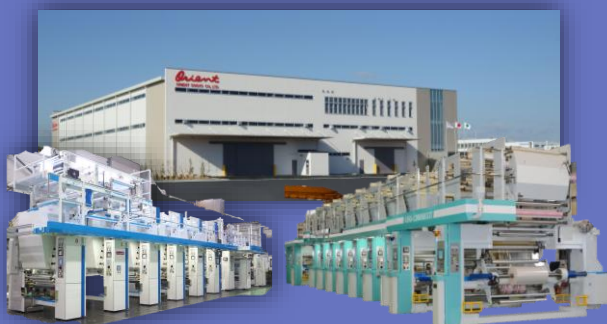
本社工場・グラビア印刷機・フレキシ印刷機