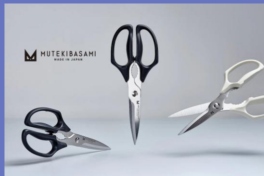
キッチン雑貨(写真はムテキバサミ)