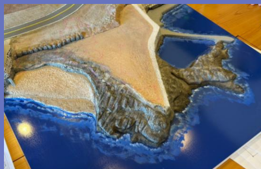
オーベルジュ開業予定地（模型）