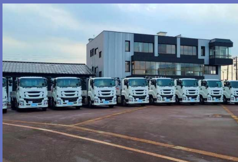
全国最大規模の教習生数（中越自動車学校）