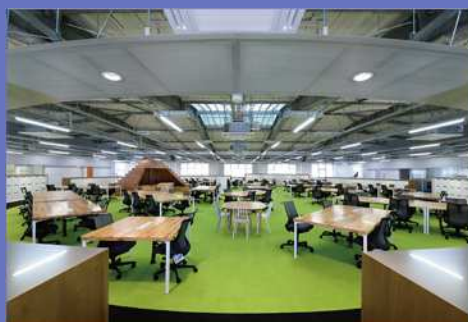
本社2階オフィス風景