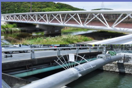
当社が設計・製造・施工を手掛けた水管橋