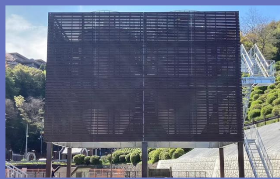
主力事業：各種設備の設計・施工