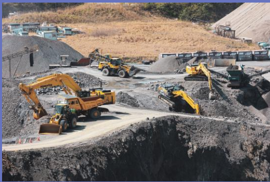
主力事業 岩石採取業・砂利採取業