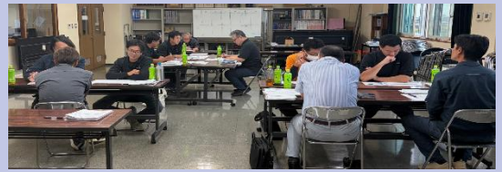
グループ横断千代田アカデミー