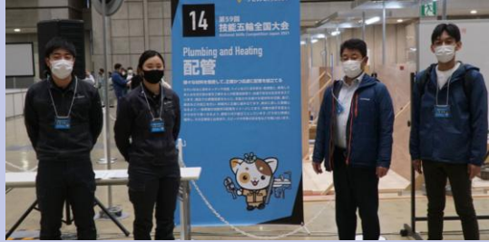
技能五輪出場支援