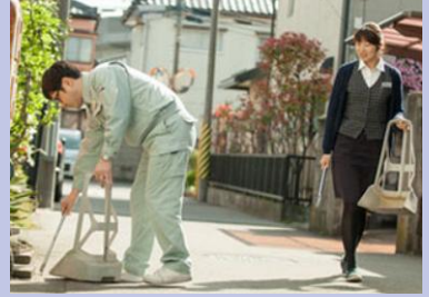
地域貢献活動 (創業当初から)