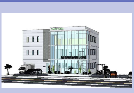
新本社棟（2027年10月完成予定）