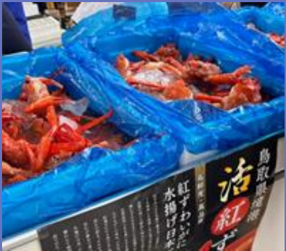
水揚げ日本一の紅ズワイガニ