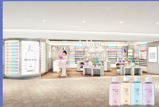
2026年2月21日第1号店の店舗イメージと主力商品