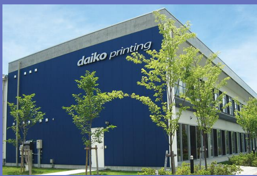
神戸ポートアイランド工場