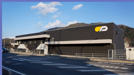
35.6%の無駄を削減したDX工場