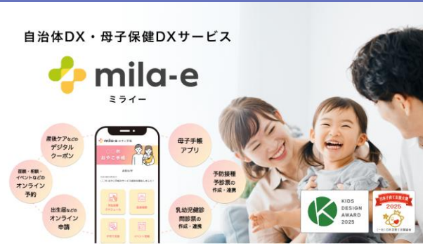
主力商品 自治体DX・母子保健DXサービス