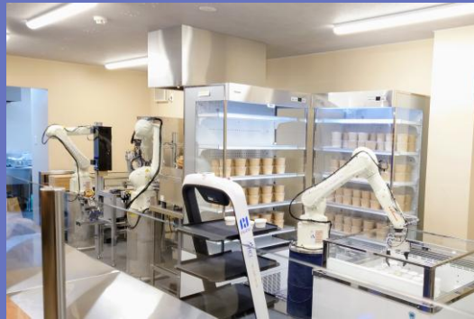
製作、運営までを行うロボカフェ