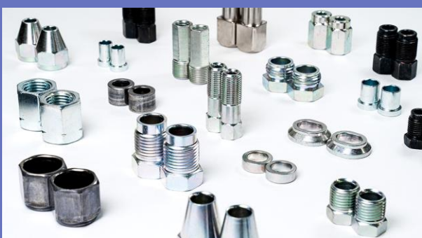
主力製品フレアナットなど