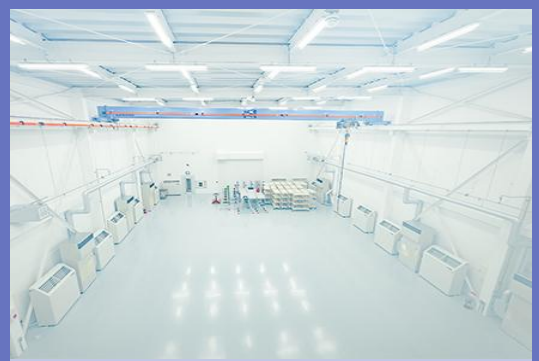
主力商品 専用機用の組立加工