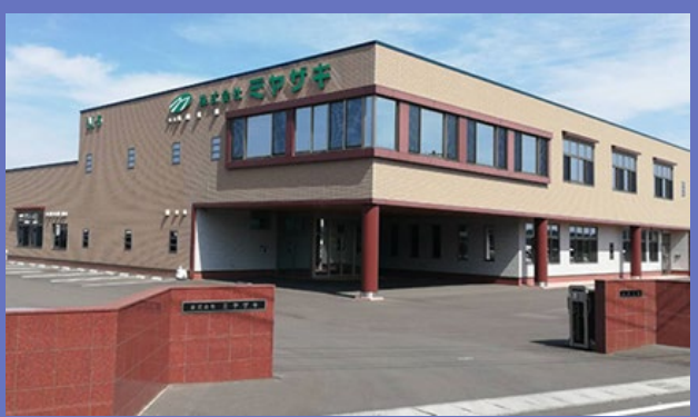
当社九州本社（九州第五工場）