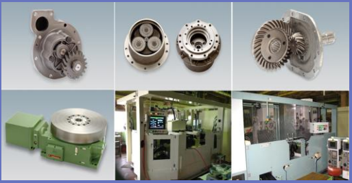
上段：船舶・建機・農機の精密部品 下段：省力機器・専用工作機械