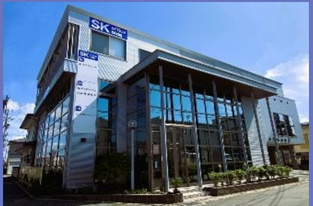
スミケングループ本社