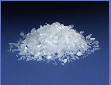
主力商品 リサイクルフレーク