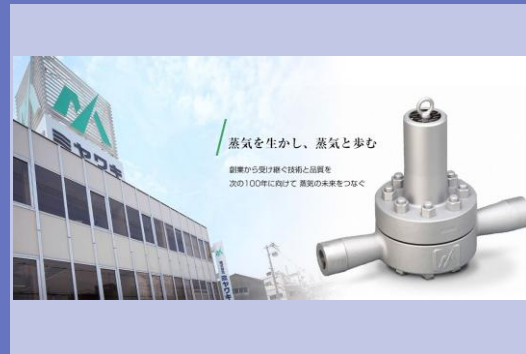
本社／高温高圧温調トラップTB型

○本社所在地：大阪府大阪市淀川区 ○事業概要：スチームトラップ、蒸気用減圧弁、蒸気瞬間給湯器など各種流体制御機器の製造・販売。蒸気・温水関連における省エネルギーのシステムコンサルティング事業 ○常時使用する従業員：142名 （2025年3月時点） ○現在の売上高：30億円 （2025年3月期） ○法人番号：3120001058700 ○Web：https://www.miyawaki-inc.com/