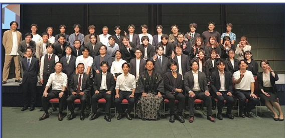
（株）キャリア・ナビゲーション 創業15周年（2025年）集合写真