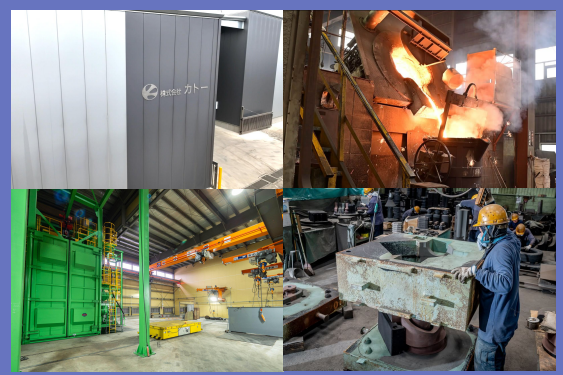
ねずみ鋳鉄から ダクタイル鋳鉄まで幅広く対応