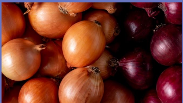
生鮮野菜の輸入・販売