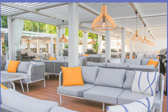
当社設計・施工のBBQ施設