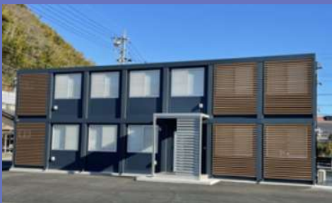
本社事務所（静岡県静岡市葵区千代）