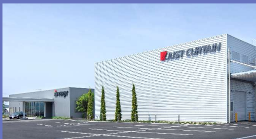
本社・和歌山工場