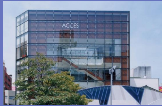
当社のランド・マーク 「アクセ広島」