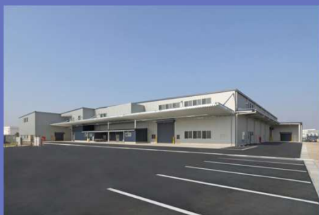
株式会社デンケン 外観