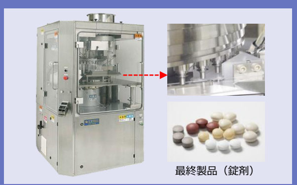
主力製品（粉体成形装置）