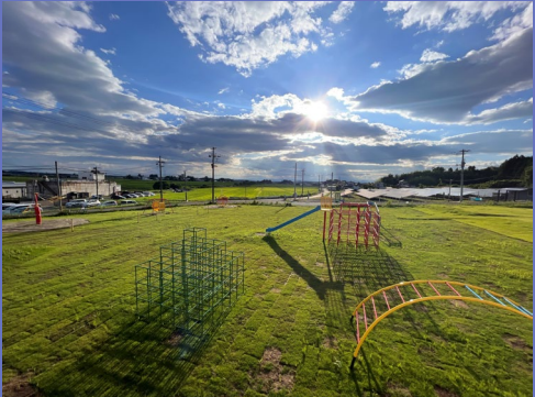
工場併設の自社公園