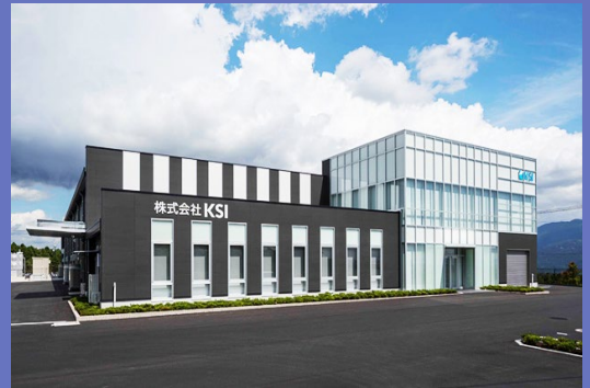
静岡県御殿場市の本社及び工場