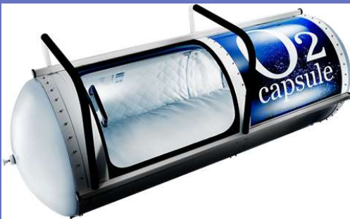
主力商品 O 2 Capsule