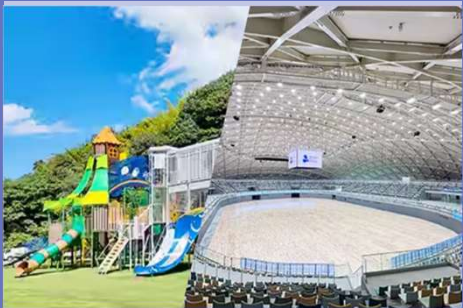
施工実績（桜川ダム下公園/あなぶきアリーナ香川）