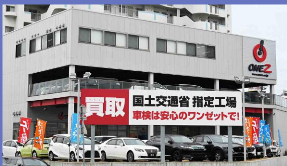
ワンゼット 東神戸