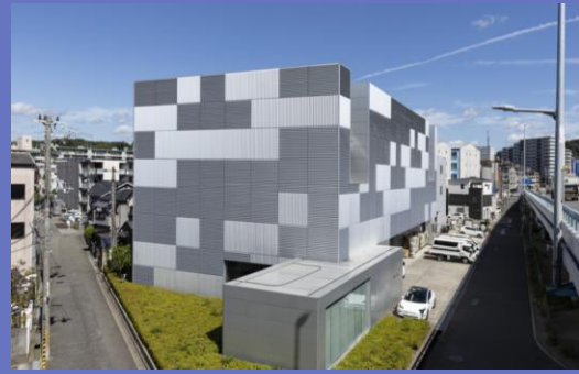
マザーファクトリー 外観