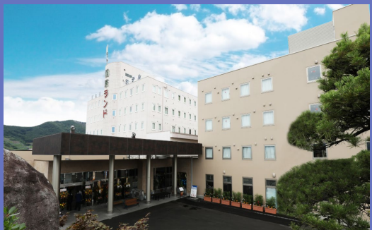
石和健康ランド（山梨）