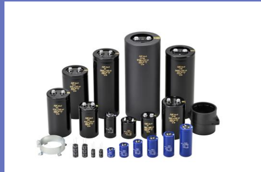
パワエレ用コンデンサ