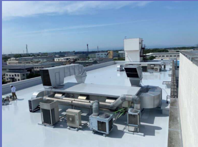
主力事業 塗装・防水