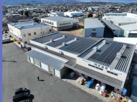
藤岡ユニフォーム工場