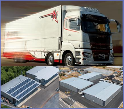
保有設備（トラック・倉庫）