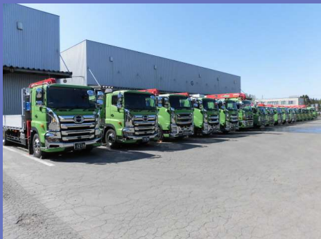
物流事業部 主カトラック