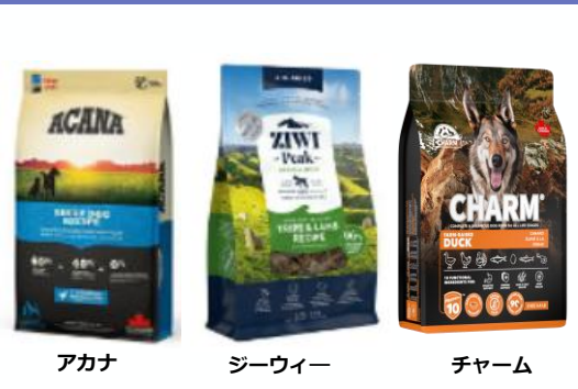
アカナ ジーウィー チャーム