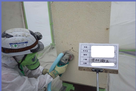
アスベスト処理業